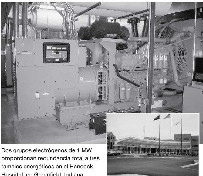
Dos grupos electrógenos de 1 MW proporcionan redundancia total a tres ramales energéticos en el Hancock Hospital, en Greenfield, Indiana.

Para recibir soporte técnico adicional, comuníquese con su distribuidor local de Cummins Power Generation. Para encontrar un distribuidor, visite www.cumminspower.com .